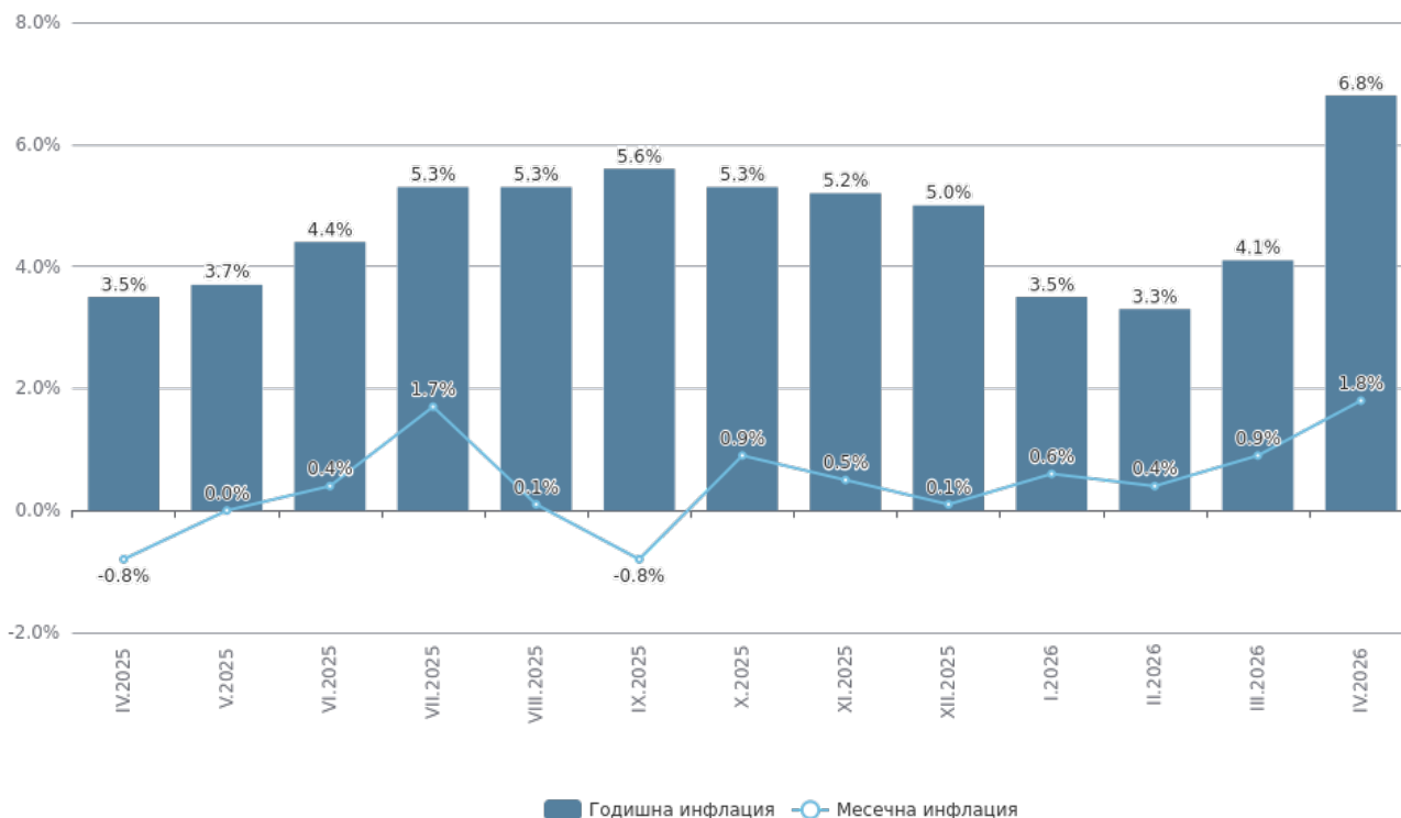
Фиг. 1. Инфлация, измерена чрез ИПЦ, по месеци

Средногодишната инфлация за периода май 2025 - април 2026 г. спрямо периода май 2024 - април 2025 г. е 4.8%.