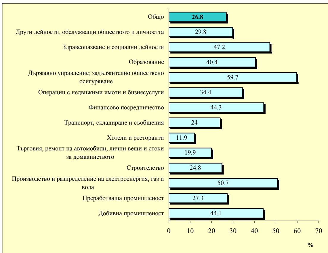
Фиг. 3. Предприятия предлагащи обучение през 2004 година по икономически дейности (по А 17)