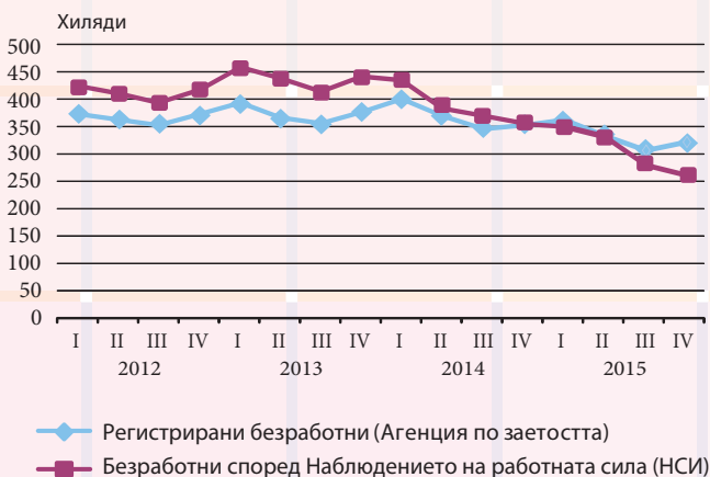
Фиг. 3. Регистрирани безработни и безработни според Наблюдението на работната сила за периода I тримесечие 2012 - IV тримесечие 2015 година

Лицата, които са определени като безработни при Наблюдението на работната сила, може да не са регистрирани в бюрата по труда, а да търсят работа по други начини. Същевременно лицата, които са регистрирани в бюрата по труда, може да не са определени като безработни, ако не търсят активно работа.