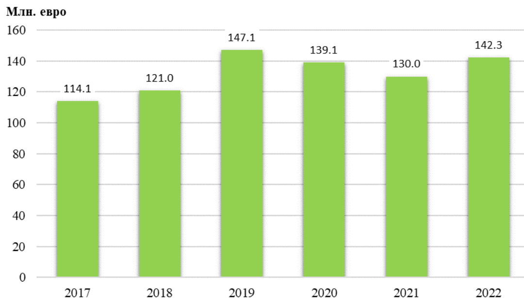
Фиг. 1. Чуждестранни преки инвестиции в нефинансовия сектор към 31.12. в област Ловеч по години

През 2022 г. най-много преки чуждестранни инвестиции са направени на територията на община Ябланица.