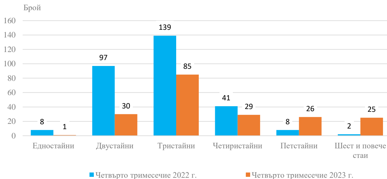
Фиг. 2. Въведени в експлоатация новопостроени жилища в област Благоевград по брой на стаите

Общата полезна площ на всички новопостроени жилища в област Благоевград през четвъртото тримесечие на 2023 г. е 33 024 кв. м, или с 32.3% повече в сравнение със същото тримесечие на 2022 г., а жилищната площ се увеличава с 35.5% и достига 30 307 кв. метра.