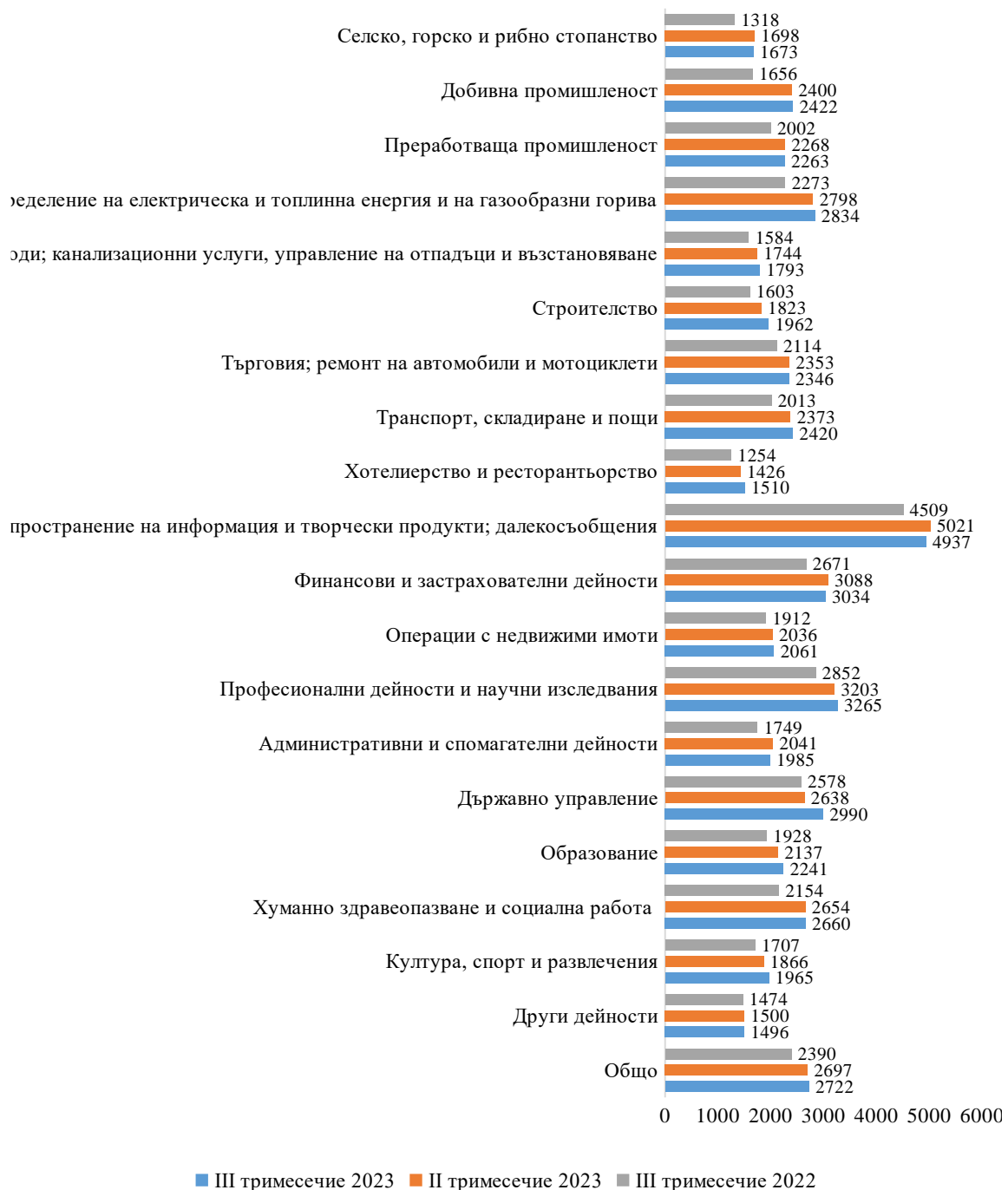
Фиг. 2. Средна брутна месечна работна заплата по икономически дейности – левове

През трето тримесечие на 2023 г. средната месечна работна заплата в област София (столица) е 2 722 лв. и нараства спрямо второ тримесечие на 2023 г. с 0.9%. Икономическите дейности, в които е регистрирано най-голямо увеличение са „Държавно управление” - с 13.4%, „Строителство” - със 7.6% и „Хотелиерство и ресторантьорство“ с 5.9%.