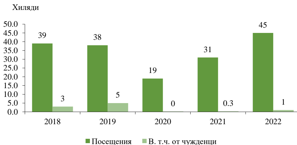
Фиг. 1. Посещения в музеите в област Перник по години

Посещенията в музеите през 2022 г. са 45 хил. и в сравнение с 2021 г. се увеличават с 44.6% (фиг. 1). В дните със свободен вход са осъществени 38.9% от посещенията (17.5 хиляди). Регистрирано е и увеличение на посещенията на чужденци в музеите - 1.4 хил., или с 352.2% спрямо предходната година.