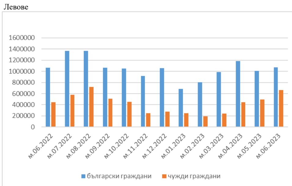
Фиг.2. Приходи от нощувки в местата за настаняване по месеци в област Велико Търново

Приходите от нощувки в област Велико Търново през юни 2023 г. са 1 736.7 хил. лв., или с 14.9% повече в сравнение с юни 2022 г. Отчетено е увеличение на приходите както от чужди граждани с 47.8%, така и от български - с 1.1%. Най-голяма част (61.3%) от реализираните приходи от нощувки през месеца в областта са постъпили в местата за настаняване, категоризирани с 1 и 2 звезди.