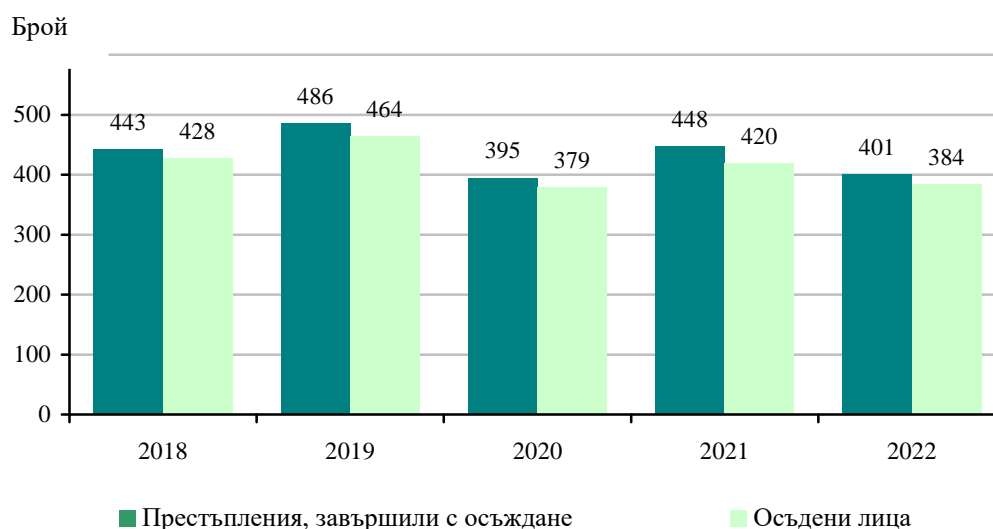
Фиг. 1. Престъпления, завършили с осъждане, и осъдени лица в област Перник през периода 2018 - 2022 година

Осъдените непълнолетни лица (14 - 17 години) са 11, или 2.9% от всички осъдени.