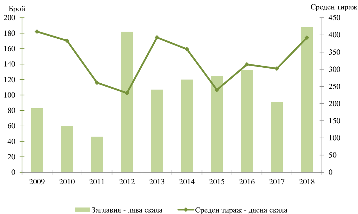
Фиг. 1. Издадени книги и брошури и среден тираж на една книга и брошура в област Стара Загора през периода 2009 - 2018 година