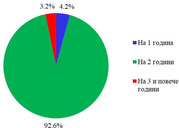
Фиг. 1. Структура на децата в детските ясли по възраст в област Смолян към 31.12.2018 година

В края на 2018 г. обхватът 1 на децата, отглеждани в детски ясли в област Смолян е 13.9% (фиг.2).