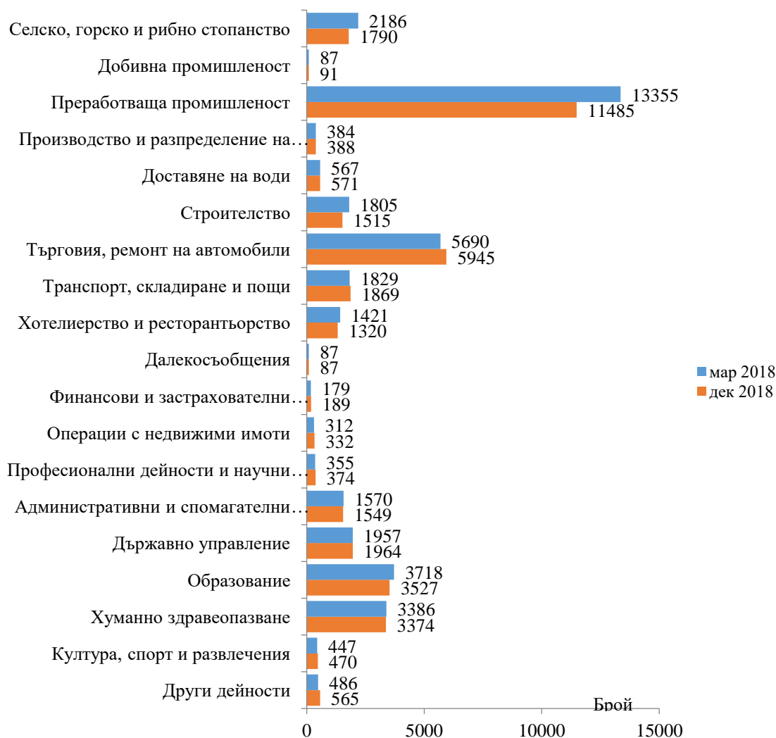
Фиг. 1. Наети лица по трудово и служебно правоотношение в област Сливен към края на декември 2018 и март 2019 година

Спрямо края на четвъртото тримесечие на 2018 г. наетите лица в общественния сектор се увеличават с 2.3% (достигат до 11.1 хил.), а в частния сектор се увеличават с 8.2% (достигат до 28.8 хил.).