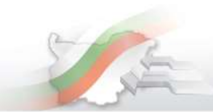
Фиг. 2. Коефициенти на обща и детска смъртност в област Бургас