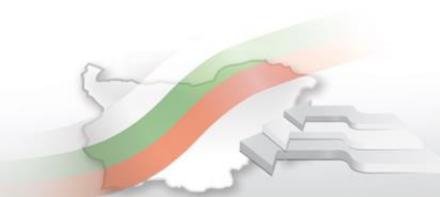
Фиг. 1. Въведени в експлоатация новопостроени жилищни сгради и жилища по области през четвъртото тримесечие на 2018 година