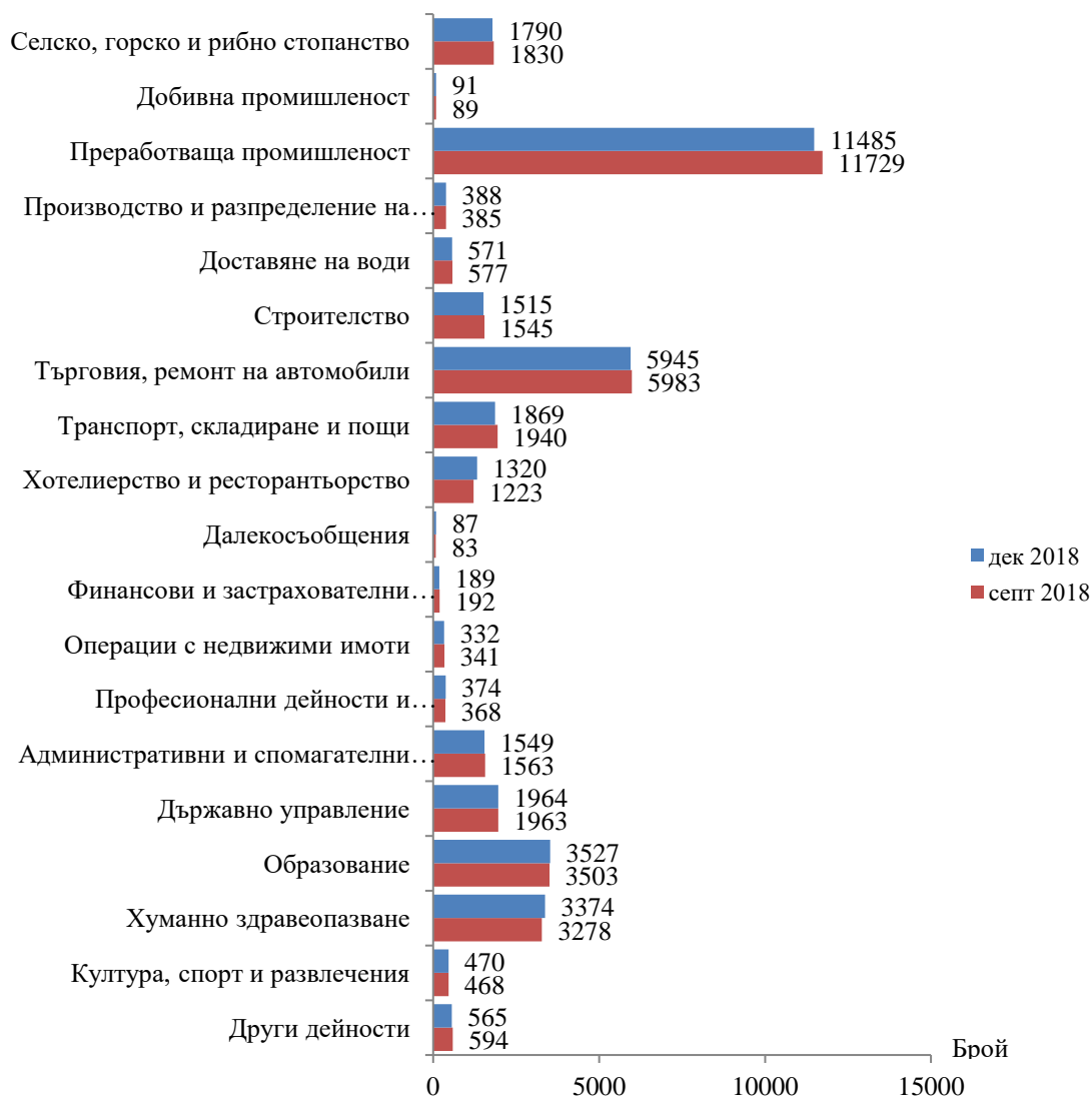
Фиг. 1. Наети лица по трудово и служебно правоотношение в област Сливен към края на септември 2018 и декември 2018 година

Спрямо края на третото тримесечие на 2018г. наетите лица в общественя сектор намаляват с 0.5% (достигат до 10.8 хил.), а в частния сектор - с 0.7% (достигат до 26.6 хил.).