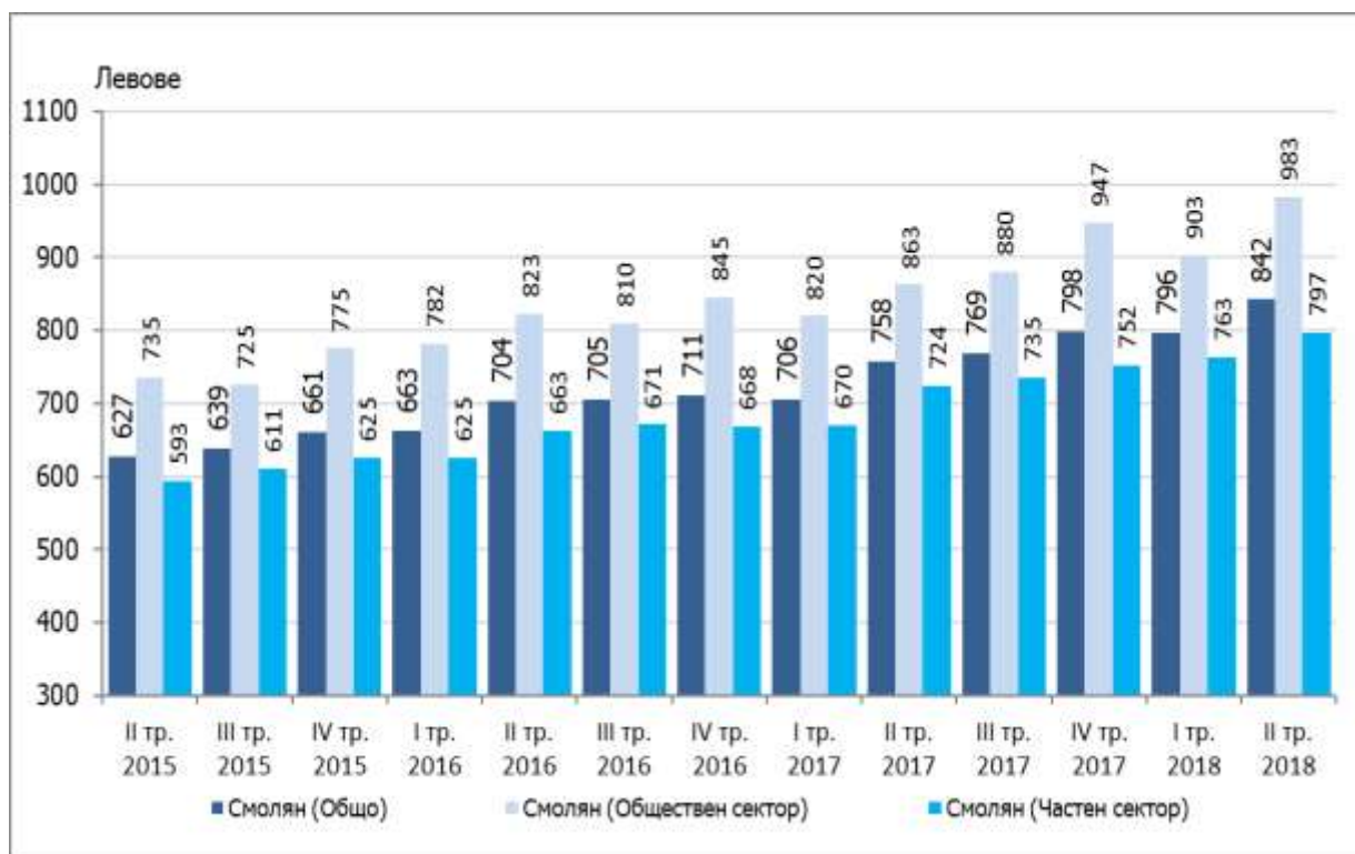
Фиг. 2. Средна брутна месечна работна заплата по сектори в област Смолян

Най-високо средномесечно трудово възнаграждение през второто тримесечие на 2018 г. са получили наетите лица по трудово и служебно правоотношение в икономическите дейности „Селско, горско и рибно стопанство”, „Добивна промишленост” и „Образование”. Най-ниско платени са били наетите лица в икономическите дейности „Транспорт, складиране и пощи”, „Операции с недвижими имоти” и „Търговия; ремонт на автомобили и мотоциклети”.