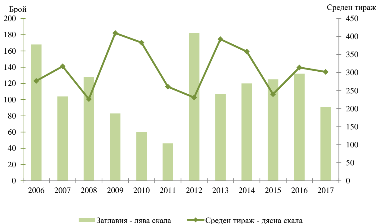
Фиг. 1. Издадени книги и брошури и среден тираж на една книга и брошура в област Стара Загора през периода 2006 - 2017 година

В сравнение с предходната година броят на издадените книги и брошури намалява с 41 (31.1%), а средният тираж 1 намалява от 314 през 2016 на 302 през 2017 г., или с 3.8%.