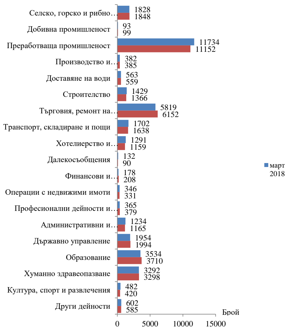
Фиг. 1. Наети лица по трудово и служебно правоотношение в област Сливен към края на декември 2017 и март 2018 година

Спрямо края на четвъртото тримесечие на 2017 г. наетите лица в общественения сектор намаляват с 1.4% (достигат до 10.5 хил.), а в частния сектор се увеличават с 2.2% (достигат до 26.5 хил.).