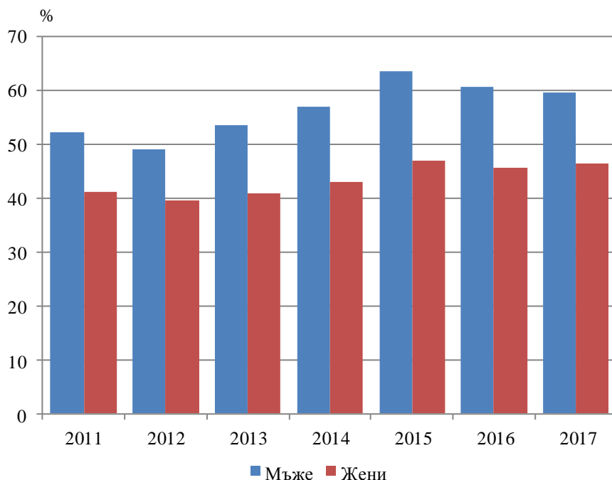
Фиг. 1. Коефициенти на заетост в област Варна по пол

• Коефициентът на заетост за възрастовата група 55 - 64 навършени години е 56.9%. В сравнение с 2016 г. той отбелязва нарастване с 1.7 процентни пункта.