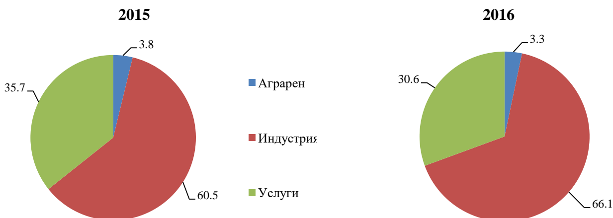
Фиг. 2. Структура на брутната добавена стойност по икономически сектори в област Стара Загора през 2015 и 2016 г.

Относителният дял на аграрния сектор представлява 3.3% от добавената стойност на областта и е в размер на 150 млн. лева. Спрямо 2015 г. той бележи намаление с 0.5%.