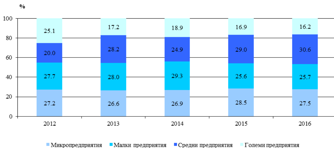
Фиг. 3. Относителен дял на дълготрайните материални активи към 31.12. в област Велико Търново по групи предприятия според броя на заетите в тях лица

Икономическите сектори с най-голяма стойност на ДМА са: