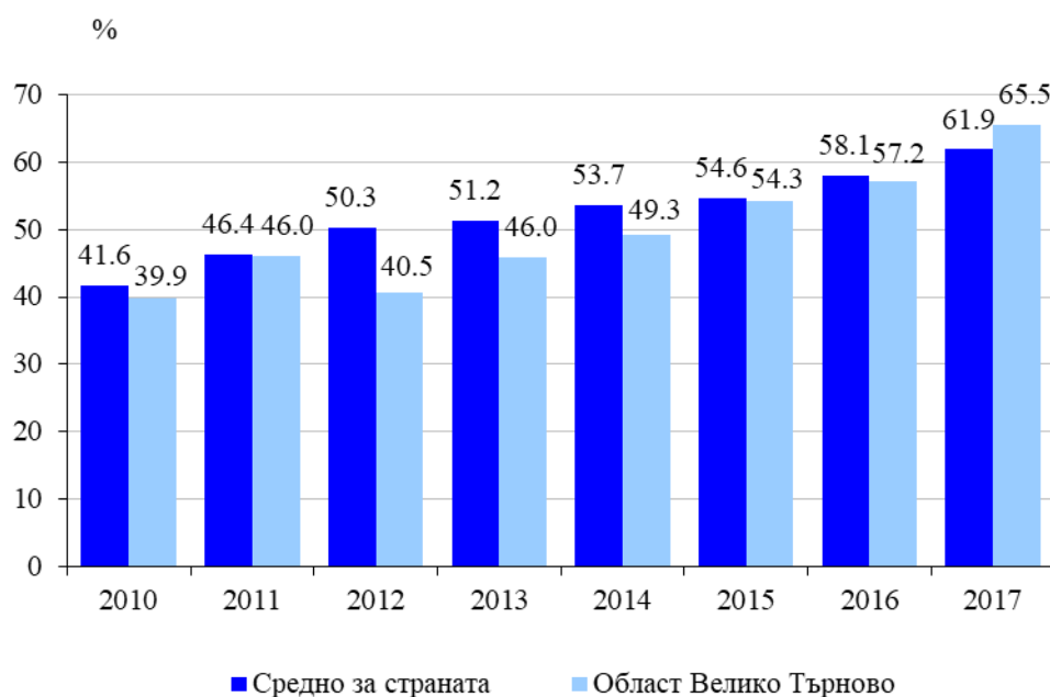
Фиг. 2. Относителен дял на лицата на възраст между 16 и 74 навършени години, използващи регулярно интернет

Значителни са различията за редовно използващите интернет по образование. Докато 85.9% от лицата с висше образование използват редовно глобалната мрежа, то едва 47.8% от лицата с основно или по-ниско образование се възползват от възможностите, които интернет предоставя.