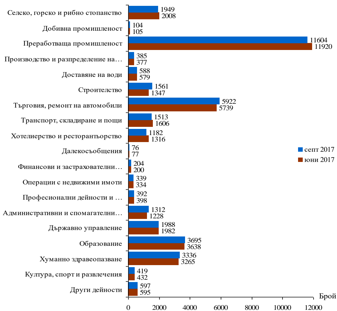
Фиг. 1. Наети лица по трудово и служебно правоотношение в област Сливен към края на юни 2017 и септември 2017 година

Спрямо края на второто тримесечие на 2017г. наетите лица в общественния сектор се увеличават с 1.2% (достигат до 10.8 хил.), а в частния сектор намаляват с 0.4% (достигат до 26.4 хил.).