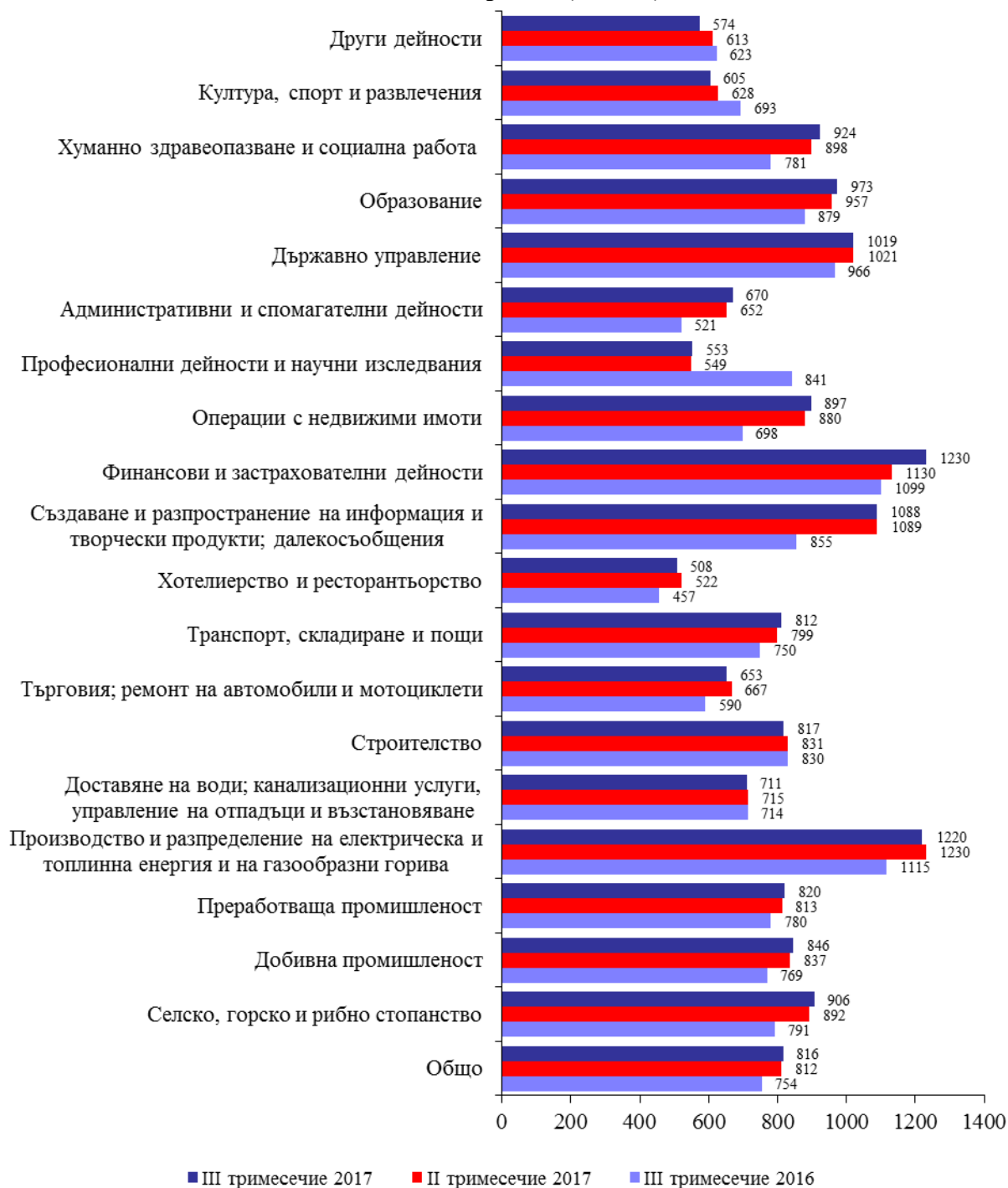
Фиг. 2. Средна месечна брутна работна заплата по икономически дейности в област Велико Търново (левове)

страната (1037 лева). В сравнение с останалите области в страната по равнище на работна заплата област Велико Търново се нарежда на 15 -то място.