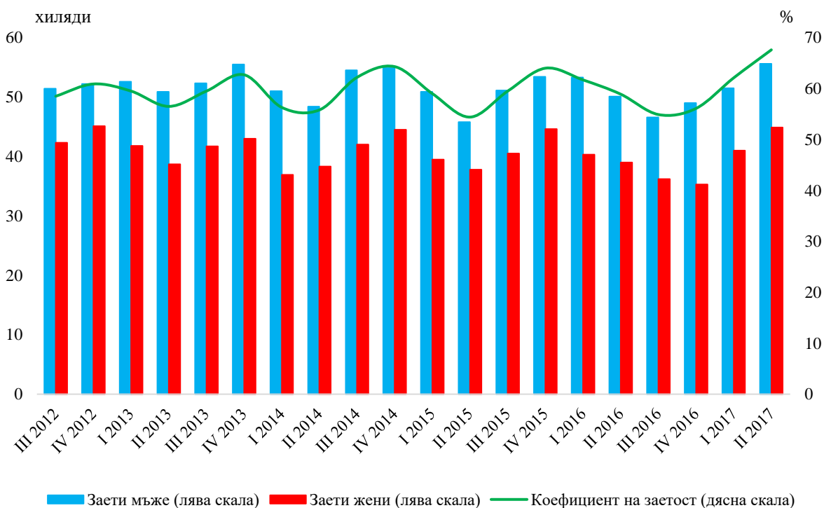
Фиг. 2. Заетост на населението на възраст 15 - 64 навършени години в Софийска област по тримесечия

Коефициентът на заетост за населението на възраст 15 - 64 навършени години през второто тримесечие на 2017 г. е 67.6%, като в сравнение със същото тримесечие на 2016 г. се увеличава с 8.7 процентни пункта. Заетите лица на възраст 15 - 64 навършени години през второто тримесечие на 2017 г. в Софийска област са 100.5 хил., като 55.6 хил. от тях са мъже и 44.9 хил. - жени. В сравнение с второто тримесечие на 2016 г. броят на заетите в Софийска област в тази възрастова група нараства с 12.7%, като броят на заетите мъже се увеличава с 11.0%, а този на жените - с 15.1%.