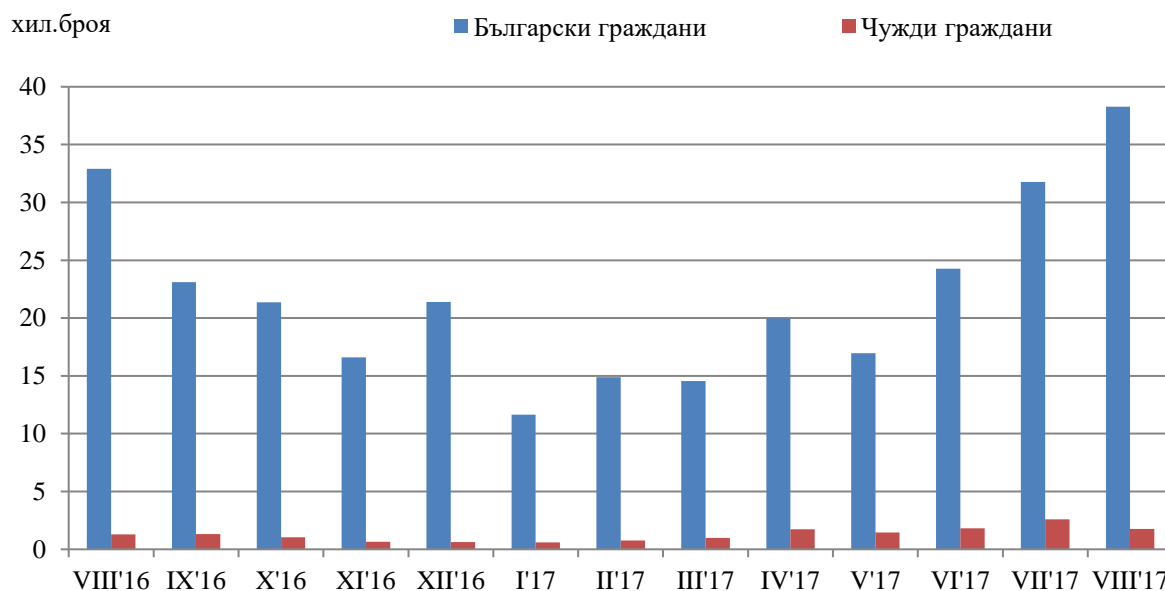
Фиг.1 Реализирани нощувки в местата за настаняване в област Ловеч по месеци

Приходите от нощувки през август 2017 г. са 1 269 966 лв., като от български граждани са 1 184 856 лв., а от чуждите - 85 110 лева. Спрямо предходния месец общите приходи от нощувки намаляват с 3.7%, приходите от нощувки на българи се увеличават с 0.5%, а тези от чужденци намаляват с 39.1%. Спрямо август 2016 г., през