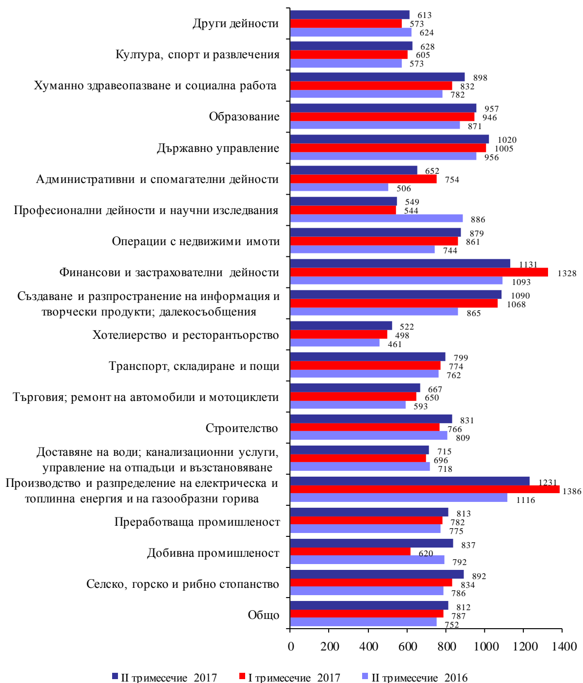
Фиг. 2. Средна месечна брутна работна заплата по икономически дейности в област Велико Търново (левове)

страната (1040 лева). В сравнение с останалите области в страната по равнище на работна заплата област Велико Търново се нарежда на 15 -то място.