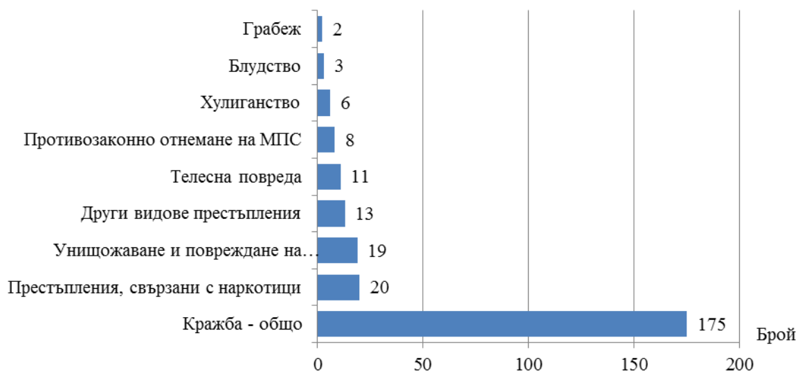
Фиг. 2. Малолетни и непълнолетни, извършители на престъпления в област Благоевград през 2016 година

лица, водени на отчет в ДПС за извършени престъпления. Най-висок е дялът на малолетните и непълнолетните лица, извършители на кражби от магазини или други търговски обекти - 24.6% (43 лица), на взломни кражби - 18.3% (32 лица), и от домовете - 12.6% (22 лица).