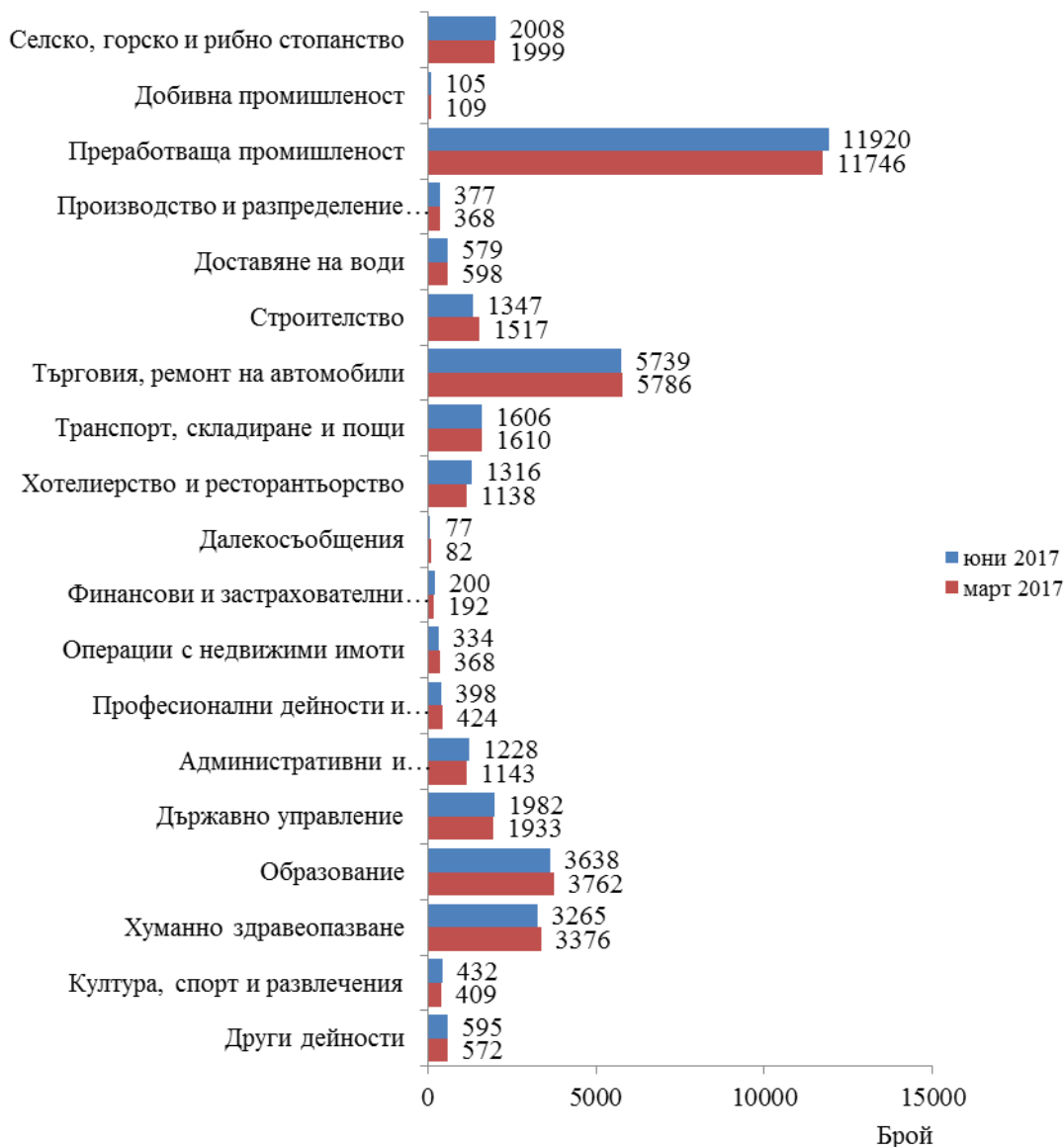
Фиг. 1. Наети лица по трудово и служебно правоотношение в област Сливен към края на март 2017 и юни 2017 година

Спрямо края на първото тримесечие на 2017 г. наетите лица в общественения сектор се увеличават с 0.5% (достигат до 10.7 хил.), а в частния сектор намаляват с 0.1% (достигат до 26.5 хил.).