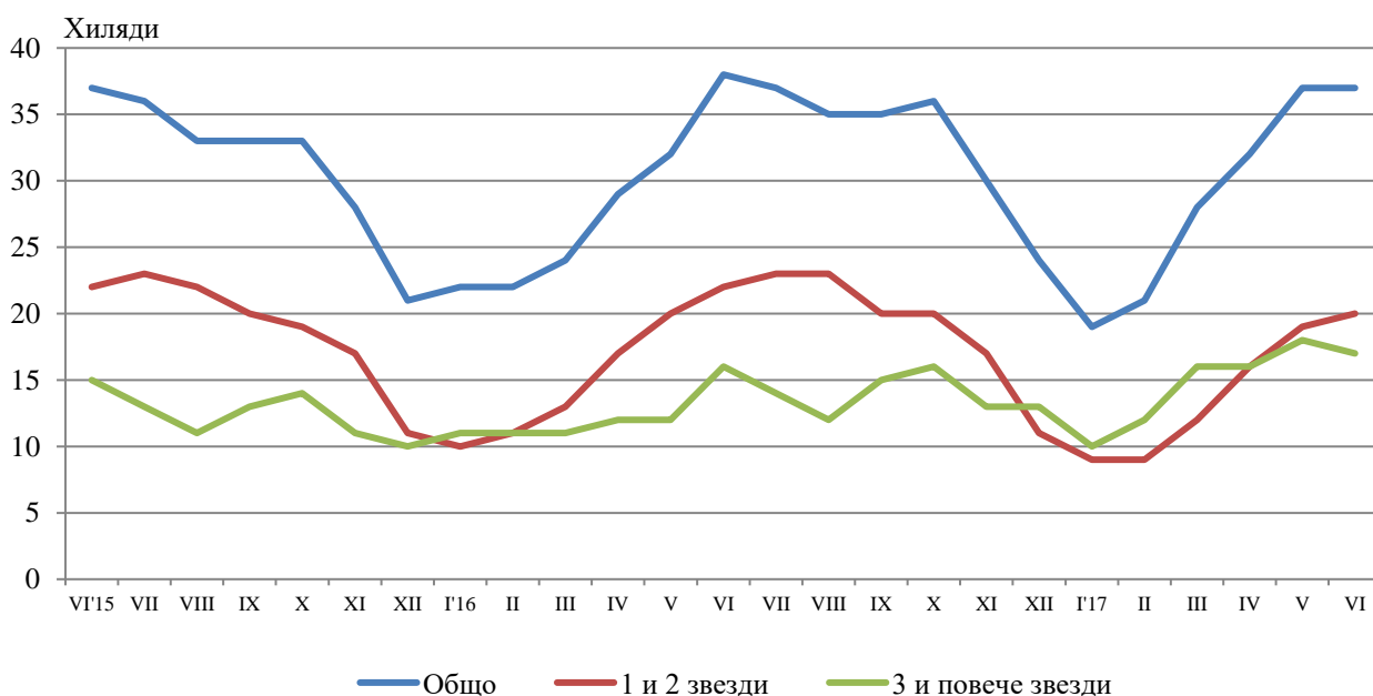
Фиг. 1. Реализирани нощувки в област Стара Загора по категории на местата за настаняване и месеци

През юни 2017 г. в местата за настаняване с 3, 4 и 5 звезди са реализирани 89.2% от общия брой нощувки на чужди граждани и 33.8% - на българи, докато в останалите места за настаняване (с 1 и 2 звезди) те са съответно 10.8 и 66.2%.