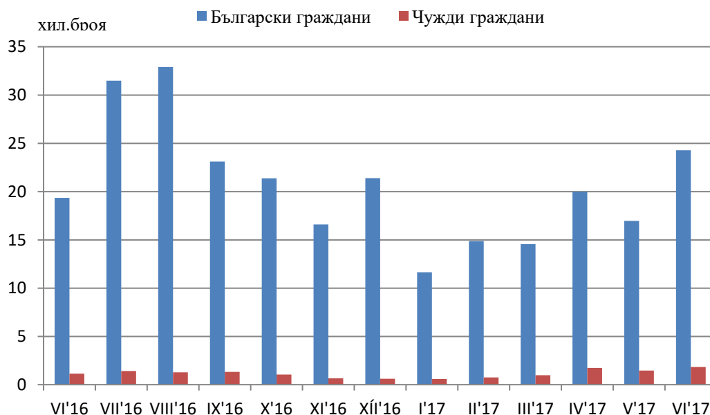
Фиг.1 Реализирани нощувки в местата за настаняване в област Ловеч по месеци

Реализираните нощувки в област Ловеч са 26 093 като 24 273 (93.0%) от тях са от български граждани, а 1 820 (7.0%) - от чужденци. Спрямо май 2017 г. нощувките се увеличават с 41.7%. В сравнение със същия период на предходната година през юни 2017 г. реализираните нощувки се увеличават с 27.4%.