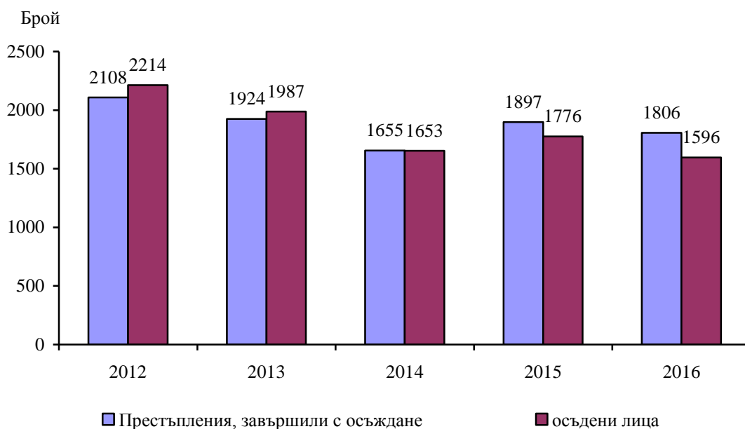
Фиг. 1. Престъпления, завършили с осъждане, и осъдени лица в област Благоевград през периода 2012 - 2016 година

През 2016 г. броят на осъдените лица с влезли в сила присъди в област Благоевград е 1 596. В сравнение с 2015 г. се наблюдава намаление с 10.1%.