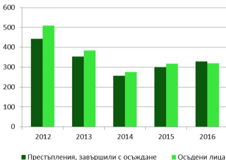
Фиг. 1. Престъпления, завършили с осъждане и осъдени лица в област Смолян през периода 2012 - 2016 година

Обвиняемите лица в област Смолян през 2016 г. са 430. От тях с ефективна осъдителна присъда са приключили делата на 139 лица или 32.3% от общия брой на обвиняемите, на 181 лица - с условно осъждане (42.1%), 106 лица са освободени от наказание (24.7%), а 3 лица са оправдани (0.7%). Делото на едно лице е прекратено.