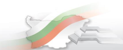
Фиг. 1. Места и деца в детските градини в област Кюстендил