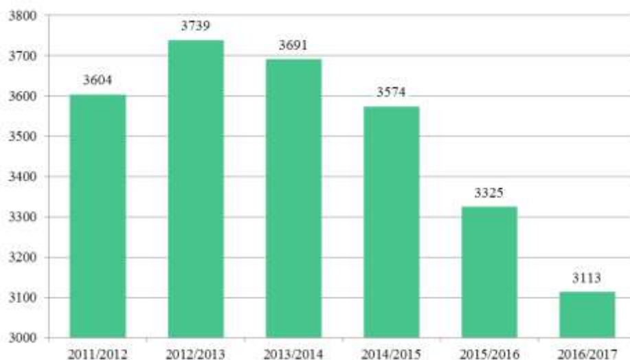
Фиг.1. Децата в детските градини в област Смолян по години

Средният брой деца в една детска градина е 62, като в градовете той е значително по-голям - 112, а в селата - 32. За страната този показател е 118 - 157 в градовете и 59 в селата. Средният брой деца формиращи една група е 20, съответно - 22 в градовете и 16 в селата.