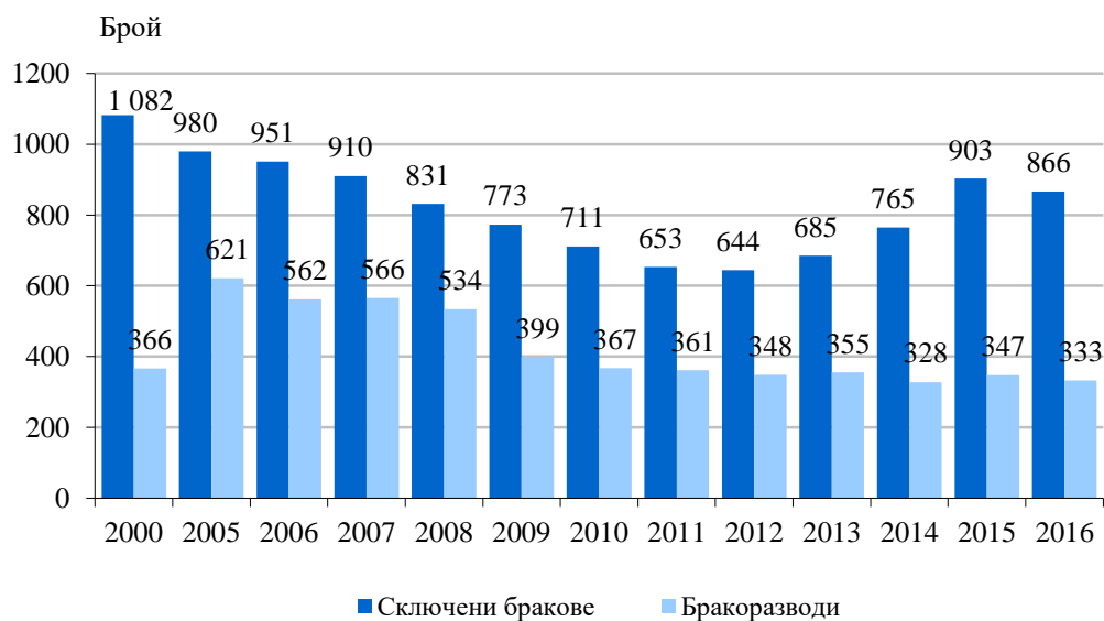
Фиг. 2. Брачност и бракоразводност в област Велико Търново