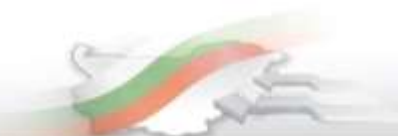
Фиг. 1. Коэффициенти на заетост по пол