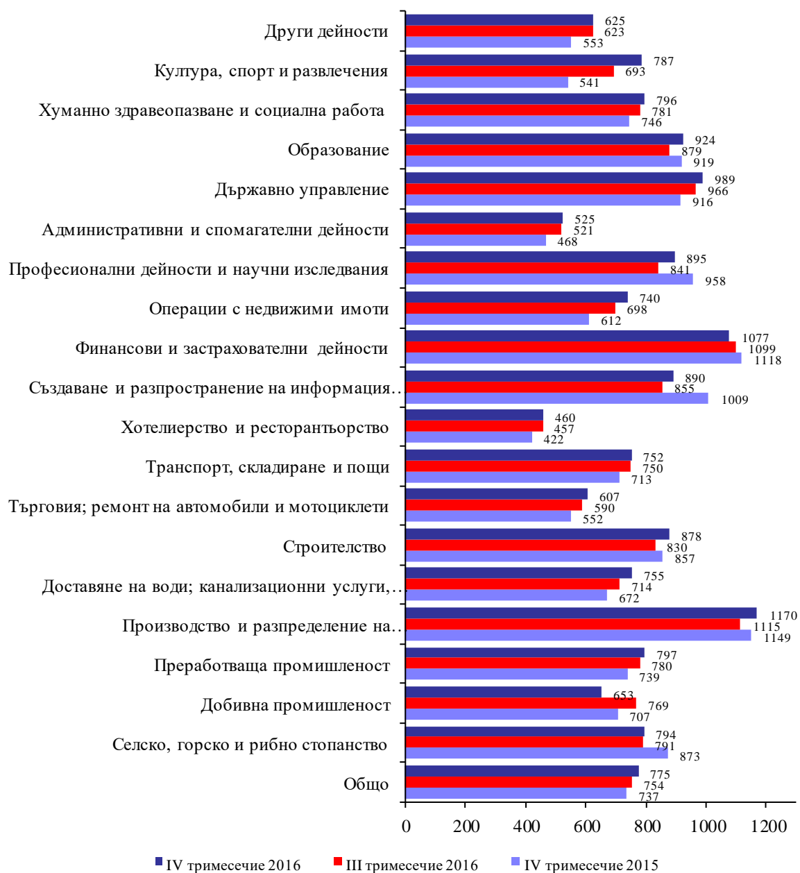
Фиг. 2. Средна месечна брутна работна заплата по икономически дейности в област Велико Търново (левове)

средната за страната (990 лева). В сравнение с останалите области в страната по равнище на работна заплата област Велико Търново се нарежда на 15 -то място.