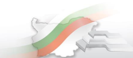
Фиг. 2. Средна месечна работна заплата по области