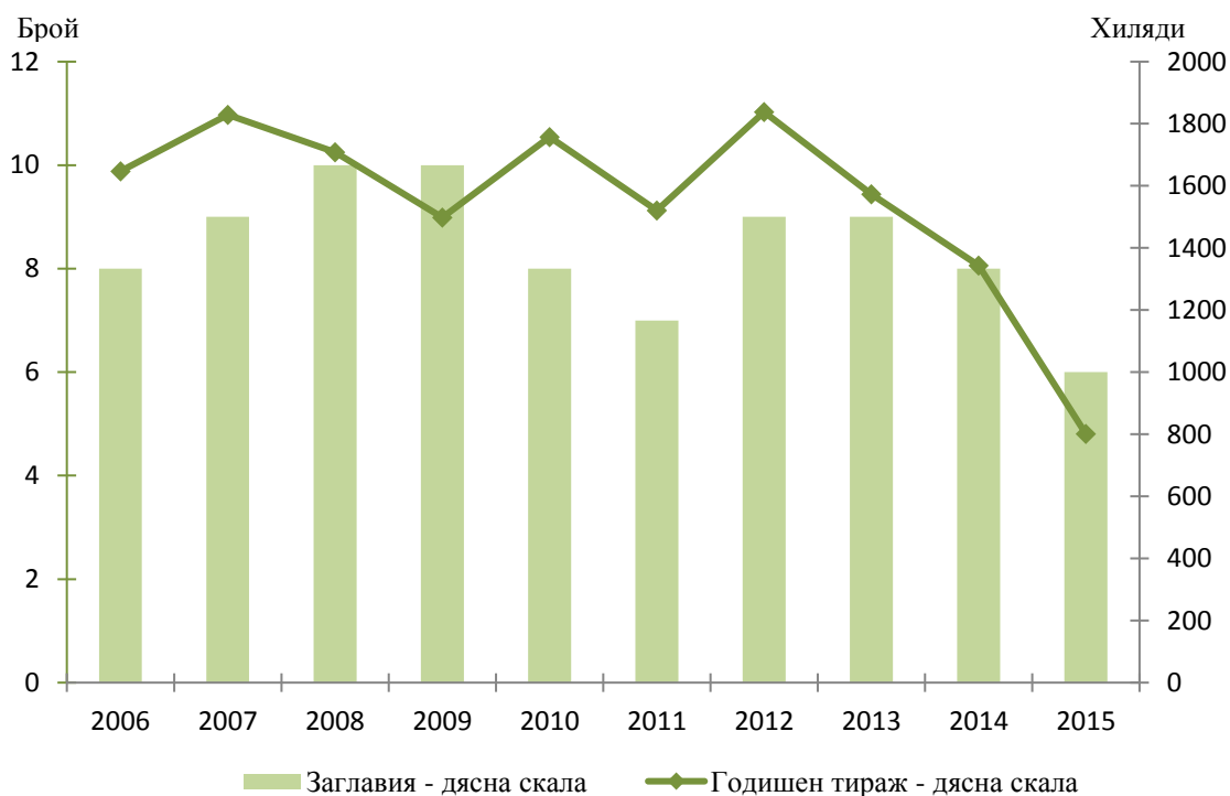
Фиг. 2. Издадени вестници в област Плевен по заглавия и годишен тираж през периода 2006 - 2015 година

Относителният дял на издаваните вестници в област Плевен е 4.2% спрямо регионалните вестници общо за страната, а годишният тираж – 3.6% от тиража на всички регионални вестници.