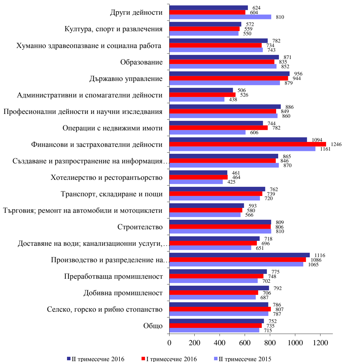
Фиг. 2. Средна месечна брутна работна заплата по икономически дейности в област Велико Търново (левове)

средната за страната (946 лева). В сравнение с останалите области в страната по равнище на работна заплата област Велико Търново се нарежда на 13 -то място.