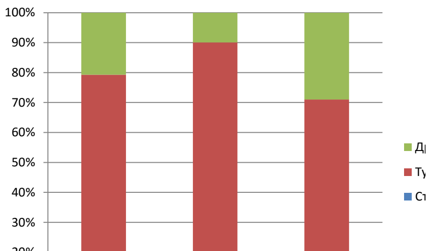
Фиг.1. Жилищни сгради по материал на външните стени в област Хасково към 31.12.2015 година

Най-голям е относителният дял на жилищните сгради построени в периода 1946 - 1960 г. - 34.1%, а най-нисък след 2011 г. - 0.4% (фиг.2).