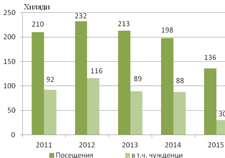
Фиг. 1. Посещения в музеите в област Добрич

Общият персонал на музеите през 2015 г. е 84, като се увеличава с 13.5% в сравнение с 2014 година.