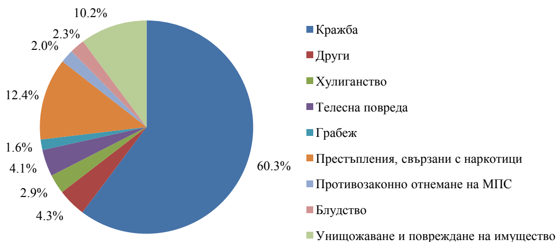
Фиг.2. Структура на малолетните и непълнолетните извършители на престъпления по видове престъпления през 2015 г. в област Бургас

Кражбите на имущество са най-разпространените престъпления, извършвани от малолетните и непълнолетните. Извършителите на кражби са 267 лица, или 60.3% от всички лица, водени на