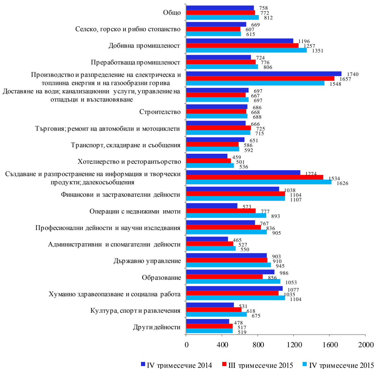
Фиг. 2. Средна брутна месечна работна заплата по икономически дейности – левове

Средната брутна месечна работна заплата в област Пловдив за октомври 2015 г. е 801 лв., за ноември - 803 лв. и за декември - 832 лева. През четвъртото тримесечие на 2015 г. средната месечна работна заплата се увеличава спрямо третото тримесечие на 2015 г. с 5.2%, като достига 812 лева. Намаление на средната месечна работна заплата е регистрирано в дейностите „Производство и разпределение на електрическа и топлинна енергия и на газообразни горива“ - с 6.6% и „Търговия; ремонт на автомобили и мотоциклети“ - с 1.4%. Икономическите дейности, в които е регистрирано най-голямо увеличение на средната месечна заплата, са „Образование“ - с 23.1%, „Операции с недвижими имоти“ - с 14.8% и „Култура, спорт и развлечения“ - с 9.2%.