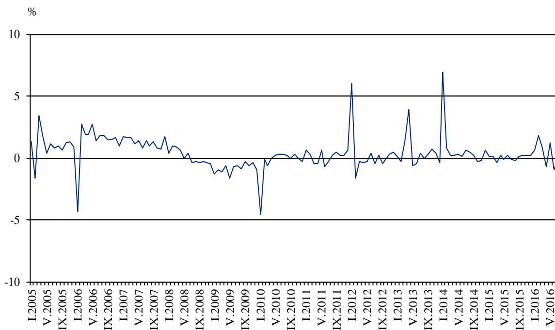
Фиг. 2. Изменение на оборота в раздел „Търговия на дребно, без търговията с автомобили и мотоциклети” спрямо предходния месец (Сезонно изгладени)

През юли 2016 г. оборотът намалява по-значително спрямо предходния месец при: търговията на дребно с компютърна и комуникационна техника - с 3.7%, търговията на дребно с текстил, облекло, обувки и кожени изделия - с 3.5%, и търговията на дребно чрез поръчки по пощата, телефона или интернет - с 3.1%. Търговията на дребно с фармацевтични и медицински стоки запазва равнището си от предходния месец.