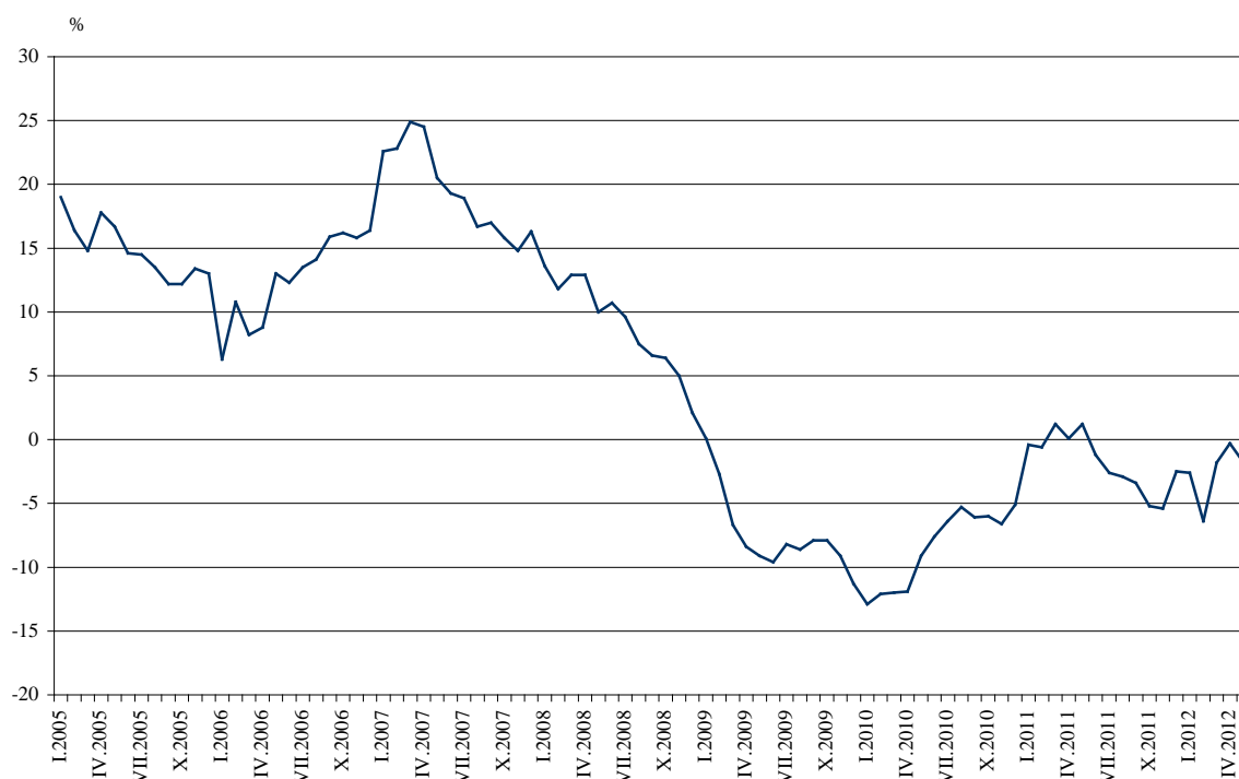
Фиг. 3. Процентно изменение на оборота в раздел „Търговия на дребно, без търговията с автомобили и мотоциклети” спрямо съответния месец на предходната година (Календарно изгледени)

През май 2012 г. оборотът бележи ръст спрямо същия месец на 2011 г. в търговията на дребно чрез поръчки по пощата, телефона или интернет - с 11.4%, в търговията на дребно с фармацевтични и медицински стоки - с 3.8%, в търговията на дребно с храни, напитки и тютюневи изделия - с 2.2%, и в търговията на дребно с компютърна и комуникационна техника - с 1.9%. Спад на оборота е регистриран в търговията на дребно с текстил, облекло, обувки и кожени изделия - с 18.0%, в търговията на дребно с разнообразни стоки - с 10.0%, в търговията на дребно с битова техника, мебели и други стоки за бита - с 5.7%, и в търговията на дребно с автомобилни горива и смазочни материали - с 2.6%.