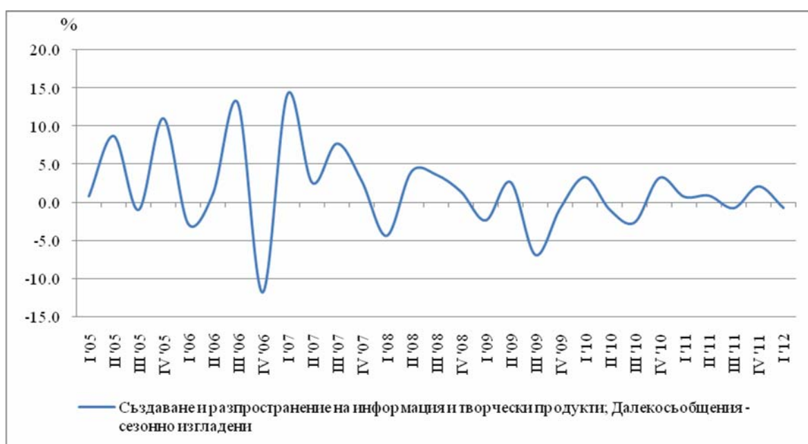
Фиг. 2. Процентно изменение на индекса на оборота в сектор „Създаване и разпространение на информация и творчески продукти; Далекосъобщения“ спрямо предходното тримесечие (Сезонно изгладени)

При Други бизнес услуги най-висок ръст спрямо предходното тримесечие е регистриран в: „Туристическа агентска и операторска дейност“ и „Административни офис дейности“ - съответно с 61.5 и с 12.0%.