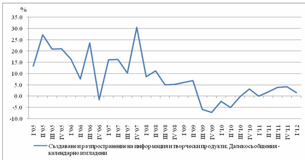
Фиг. 3. Процентно изменение на индекса на оборота в сектор „Създаване и разпространение на информация и творчески продукти; Далекосъобщения” спрямо съответното тримесечие на предходната година (Календарно изгладен)

При Други бизнес услуги най-голямо увеличение спрямо първото тримесечие на 2011 г. е отчетено в: „Туристическа агентска и операторска дейност” - с 14.8%; „Дейности по охрана” и „Административни офис дейности” - с по 11.8%. Спад е регистриран при „Други професионални дейности” - с 28.2%, „Рекламна дейност” - с 19.7%, и „Архитектурни и инженерни дейности” - с 16.1%.