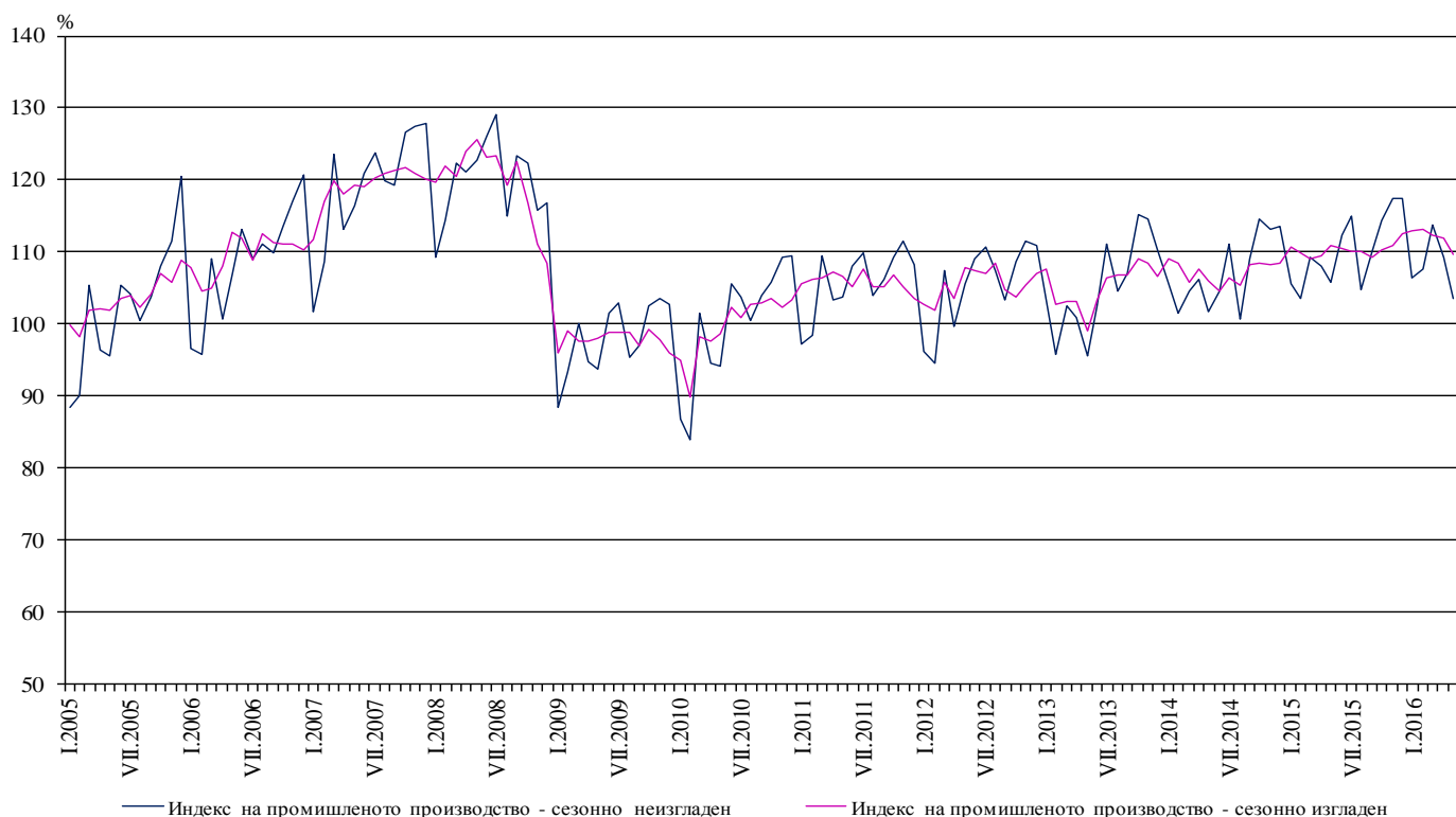
Фиг. 1. Индекси на промишленото производство (2010 = 100)

През май 2016 г. при календарно изгладения индекс 4 на промишленото производство е регистриран спад от 3.3% спрямо съответния месец на 2015 година.