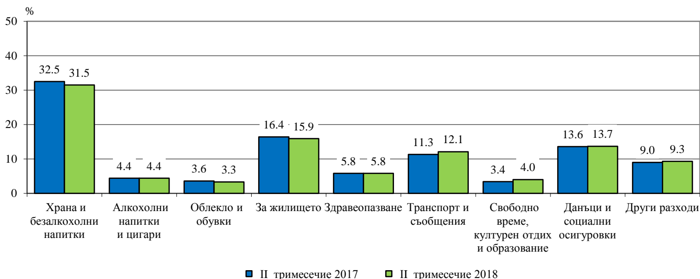
Фиг. 2. Структура на общия разход на домакинство през второто тримесечие на 2017 и 2018 година

Спрямо второто тримесечие на 2017 г. относителният дял на разходите за храна и безалкохолни напитки намалява с 1.0 процентен пункт, а делът на разходите за транспорт се увеличава с 0.7 процентни пункта.